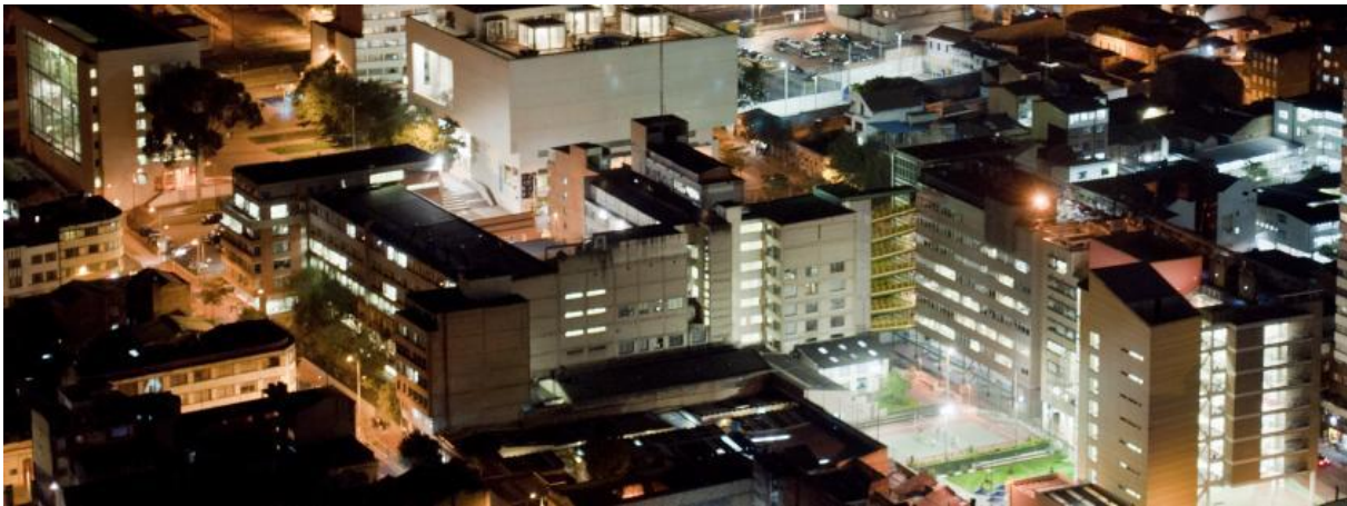
UNIVERSIDAD DE BOGOTÁ JORGE TADEO LOZANO www.utadeo.edu.co

La Red Colombiana de Semilleros de Investigación RedColsi NODO BOGOTÁ – CUNDINAMARCA tiene el agrado de invitar nuevamente a la comunidad investigativa estudiantil a nuestro XVI Encuentro Regional de Semilleros de Investigación.